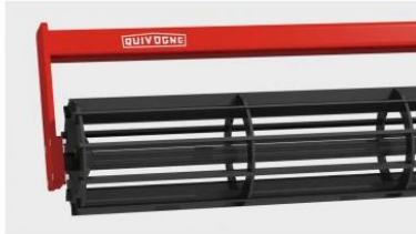
Ø 450 mm-es pálcás henger