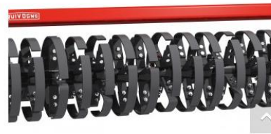
Ø 600 mm-es Lamflex henger