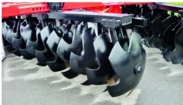
Fleaux-Fleaux keverőtárcsák, Ø 810x10 mm