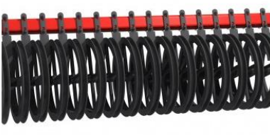
Ø 600 mm-es U-henger sárkaparóval