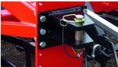
Erősített vonóhorog hátul