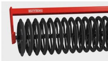
Ø 600 mm-es T-henger sárkaparóval