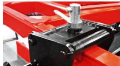
A tárcsasor rögzítés alappfelszereltség