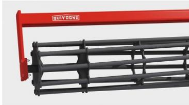
Ø 450 mm-es rudas henger