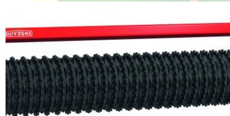
Ø 550 mm-es Cambridge henger