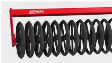
Ø 600 mm-es L-henger sárkaparóval