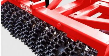
Ø 530 mm-es Crosskill henger