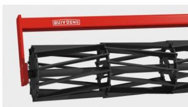
Z-henger, \varnothing 500 mm