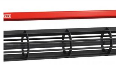
Pálcás henger, \varnothing 450 mm