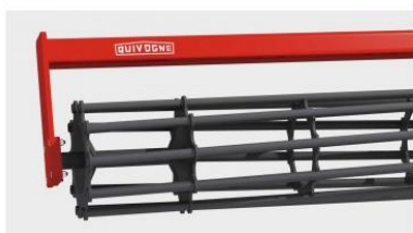
Csőpálcás henger, \varnothing 450 mm