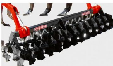
Kétsoros, \varnothing 500 mm-es hullámos tárcsás henger