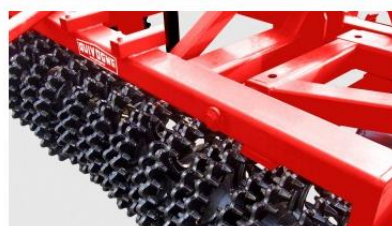
CROSSKILL henger, \varnothing 550 mm