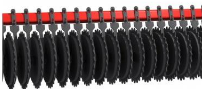
RollSteel henger sárkaparóval, \varnothing 520 mm